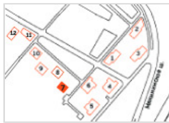
На плане квартала