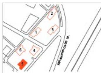
На плане квартала